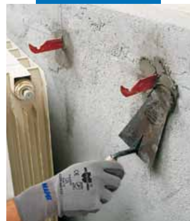
Radiátor konzoljainak rögzítése Lampocem-mel