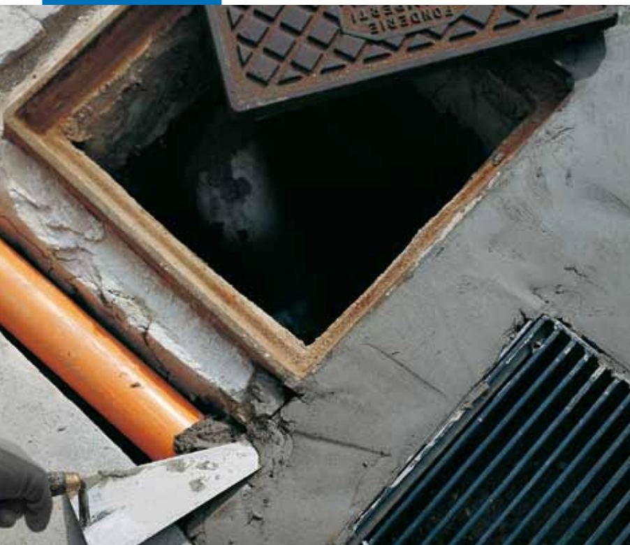
Csővek és aknafedő elhelyezése Lampocem-mel